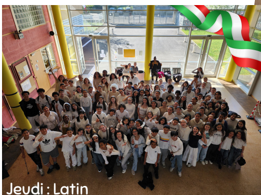
Jeudi : Latin

Vendredi, les élèves ont pu s'initier à la LSF, Langue des Signes Française.