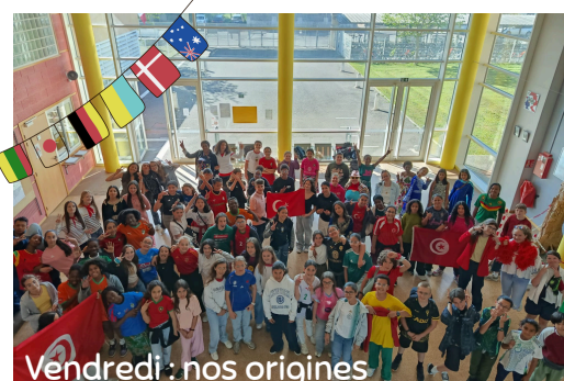
Vendredi : nos origines

Un grand bravo et merci à toutes celles et ceux qui ont participé à faire vivre cette belle semaine, et bien sûr aux organisateurs.