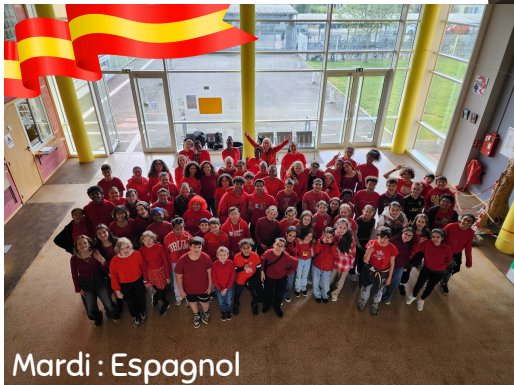
Mardi : Espagnol