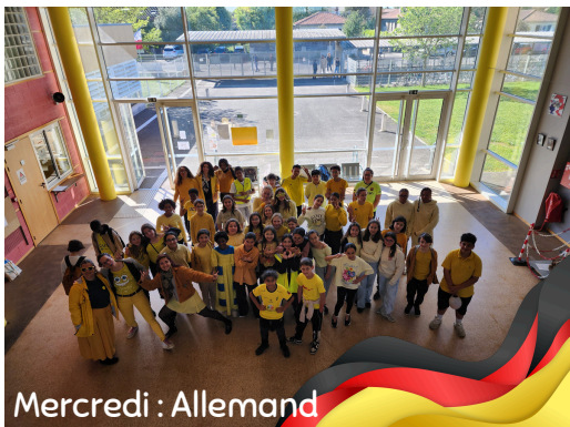
Mercredi : Allemand