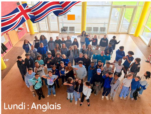
Lundi : Anglais

La semaine avant les vacances de printemps a été festive au collège grâce à l'organisation de la semaine des langues .